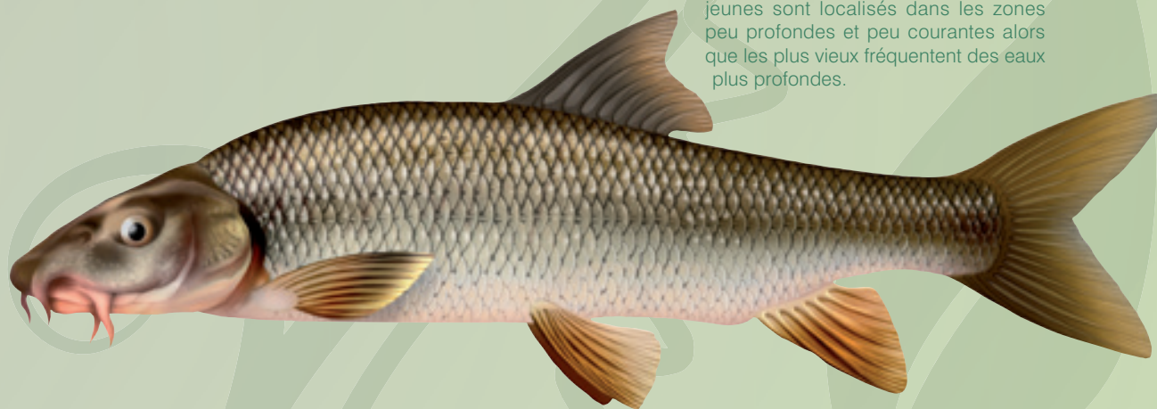
© Illustration de poisson / P.J. Dunbar

Ce poisson possède un corps allongé, cylindrique et fin. La forme de son ventre est adaptée à la vie sur le fond. Munies de deux paires de barbillons, les lèvres de sa bouche sont épaisses et charnues. Ses nageoires caudales sont de teinte orangé (sa nageoire anale et pelvienne également).