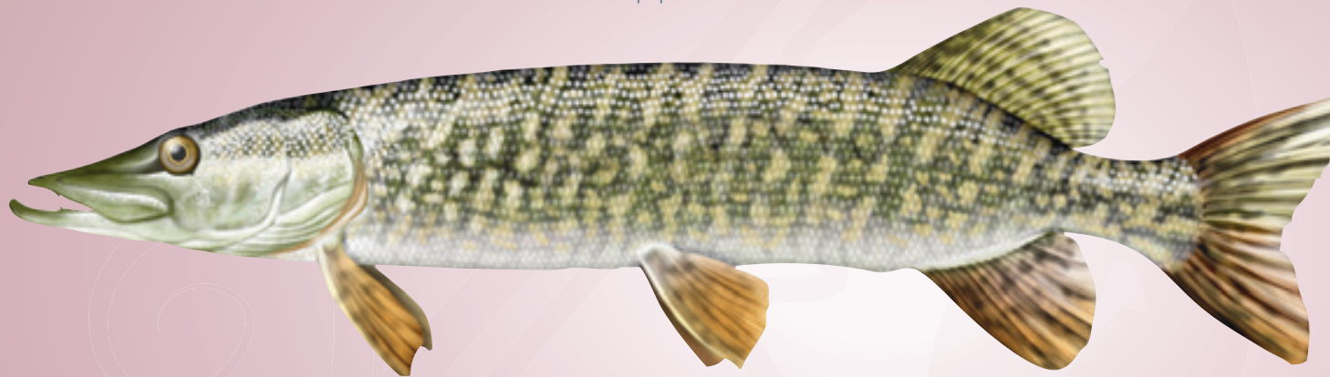
© Illustration de poisson / P.J. Dunbar

La nageoire dorsale est petite, très reculée, proche de la caudale et implantée au niveau de l'anale. Cette disposition particulière lui permet de bondir sur ses proies à la vitesse de 3m/sec .